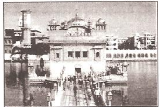
स्वर्ण मंदिर, हरमंदिर साहिब, अमृतसर